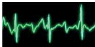
Sinal filtrado pelo See-Thru CPR