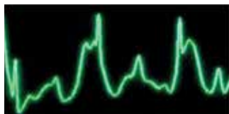
Sinal de ECG não filtrado durante a RCP

O X Series também conta com o See-Thru CPR®, exclusividade da ZOLL. O See-Thru CPR filtra os artefatos de compressão para que o ritmo cardíaco subjacente do paciente possa ser exibido durante a RCP. Ao possibilitar que o profissional de resgate visualize o ritmo subjacente, esta tecnologia minimiza a duração das pausas nas compressões.